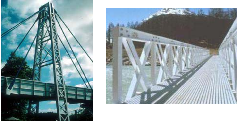
Figura 3: Pasarelas de Aberfeldy y Pontresina

En 2001 se construyó la primera en España, sobre la línea del AVE cerca de Lérida. Es un arco biapoyado de 38 m de luz y 3 m de ancho. Se emplearon uniones mecánicas.