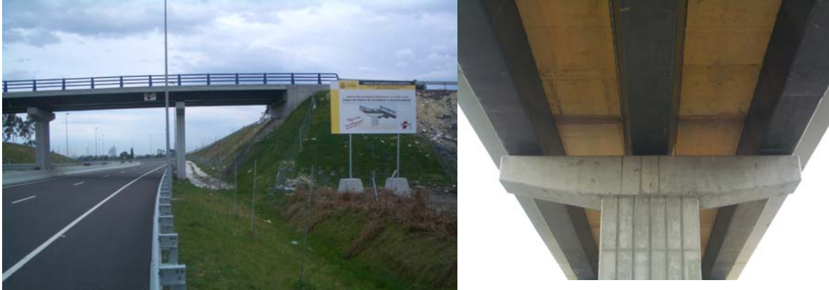
Figura 2: Primer puente de materiales compuestos construido en España (2004)

carretero de materiales compuestos construido en España en 2004 pertenece a esta tipología. Se trata de un puente híbrido construido por Acciona con vigas de polímeros armados con fibra de carbono y tablero de hormigón armado. En el apartado 5 se describen brevemente algunos ensayos realizados para la construcción de este puente.