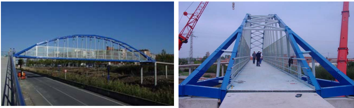
Figura 4: Pasarela sobre el AVE en Lérida, proyecto de PEDELTA

En 2001 se construyó la primera en España, sobre la línea del AVE cerca de Lérida. Es un arco biapoyado de 38 m de luz y 3 m de ancho. Se emplearon uniones mecánicas.